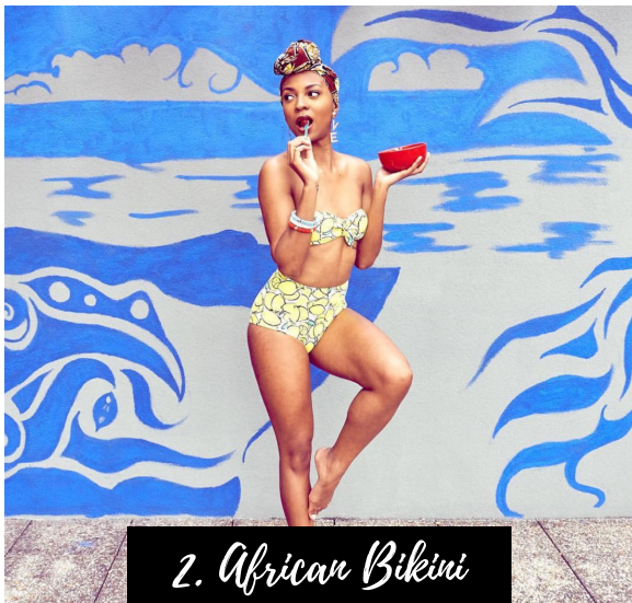
2. African Bikini