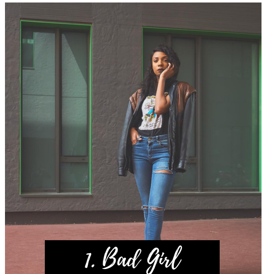
1. Bad Girl